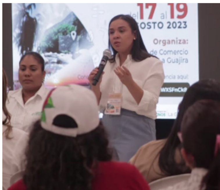
La mandataria seccional exaltó la riqueza natural y el inmenso potencial turístico del Departamento.

genas Wayuu y para evitar que más niños en Riohacha y los municipios de Maicao, Uribia y Manaure se sigan muriendo de desnutrición. "Promesa Continua" es el nombre que el comando Sur de los Estados Unidos ha establecido para brindar cuidado médico, asistencia humanitaria y apoyo cívico a las comunidades de América Latina y el Caribe en nombre del pueblo estadounidense, con personal militar, socorristas y civiles voluntarios; hacen parte de esta misión especialistas en pediatría, ginecología, ortopedia, oftalmología, odontología, podología, dermatología, medicina familiar y educación en salud pública.