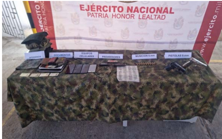
Sujetos capturados en Cuestecita por las autoridades que los señalan de ser integrantes del Clan del Golfo.

Gracias a la inteligencia militar, el Grupo de Caballería Blindado Mediano General Gustavo Matamoros D'Costa, junto al Bata-