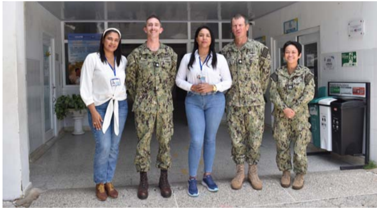
El personal médico brinda cuidado médico, asistencia humanitaria y apoyo cívico a las comunidades.

lada de la institución. Esta labor se realiza debido a la declaratoria de emergencia humanitaria que hizo el Gobierno Nacional, a raíz de la desnutrición de los niños en el departamento de La Guajira y dar cumplimiento a la sentencia de la Corte Constitucional T-302 de 2017, la cual declaró el estado de cosas inconstitucionales frente a la protección especial de los derechos al agua, salud y alimentación para las comunidades indí-