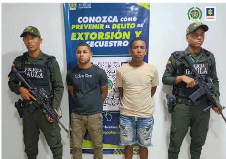
Se presume que los capturados le exigían a su víctima el pago de un millón doscientos mil pesos.

el pago de un millón doscientos mil pesos a cambio de devolvérselo.