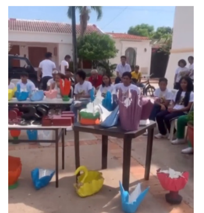
La feria promovió el intercambio de saberes.

neación, instituciones educativas municipales, Cámara de Comercio, la Corporación Autónoma Regional de La Guajira, Max Resource y delegaciones aliadas de otros municipios.