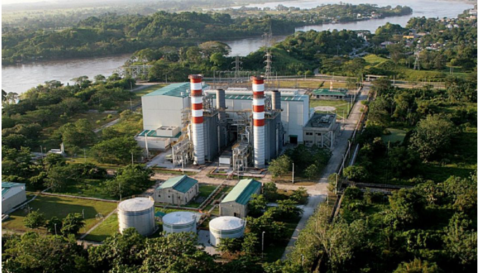
La energía que se deje de generar por estas plantas no habría manera de suplirla por otra proveniente del interior del país.

Por lo demás, Gecelca, que es del Estado, tiene vendida la energía que genera por los próximos años, cabe preguntarse si el Estado va a responder honrando sus compromisos prestando garantía de la Nación para su reconversión, por