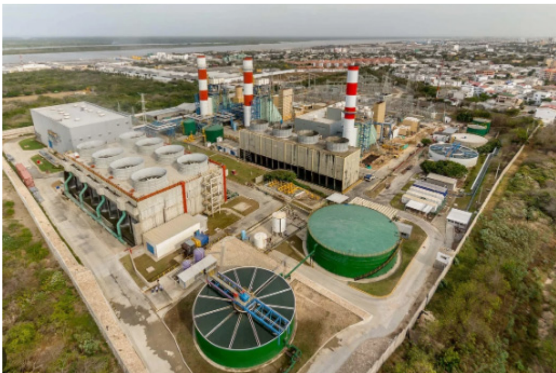
Las plantas son duales y pueden operar con gas natural que es mucho menos contaminante.