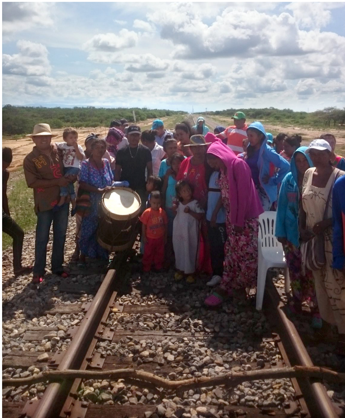
Las pérdidas económicas para la empresa, La Guajira y el país son enormes.

Los intereses de los líderes de esta ONG no pueden volver admisible que se pretenda hacer responsable a Cerrejón de decisiones y acciones que van más allá de su responsabilidad legal.