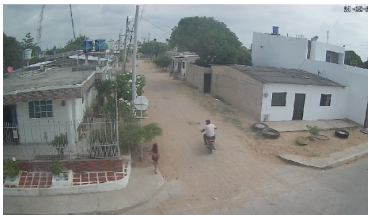
El sujeto se moviliza en una motocicleta de color rojo con negro. Es de contextura gruesa y moreno.

En videos difundidos en las redes sociales denunciaron a un sujeto que presuntamente está acosando a menores de edad en varios sectores de Maicao, donde lo han visto conducir una motocicleta y se les acerca a sus víctimas invitándolas a subir al rodante.