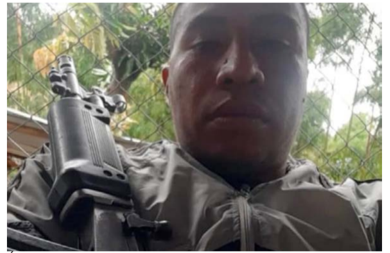
Este hombre sería el responsable de ataques en contra de la población civil y la Fuerza Pública en el suroccidente del país.

Centro, ya que durante el fin de semana se originaron dos muertes violentas, precisamente propiciadas por sujetos que se movilizaban en motocicletas.