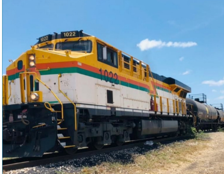
Cerrejón confía en que Nación Wayuu muestre un liderazgo constructivo, como lo ha hecho con otras 69 comunidades.

Los bloqueos ilegales de la línea férrea en el Cerrejón impactan negativamente a todos en La Guajira, incluidos los miembros de la comunidad y las empresas.