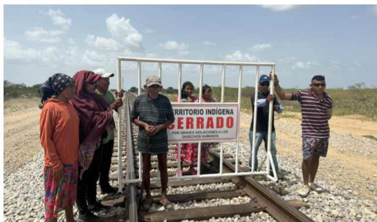
Los wayuú se declararon en asamblea permanente por presuntas violaciones de sus derechos como pueblos indígenas.

y aunque mencionan que “supuestamente” existen 163 comunidades que se benefician con el Tren del Agua, insisten en que existen otras comunidades en total abandono que consumen agua contaminada. Exigen que todas las comunidades, aún más lejanas de la línea férrea, sean tratadas como parte del área de influencia de Cerrejón.