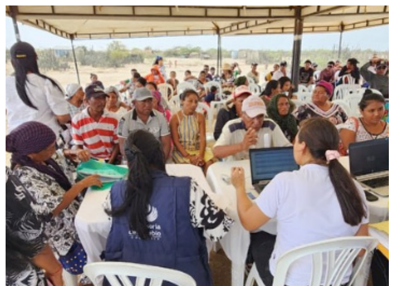
La jornada tuvo lugar en días pasados en el corregimiento de Irrai-pa, comunidad Portete y la comunidad La Loma.

La actividad se dio en articulación con el Icbf, Defensoría del Pueblo, Ejército Nacional, Sena regional, Secretaría de la Mujer, Acción Social, Secretaría de Salud y Unidad para Víctimas Cesar – La Guajira.