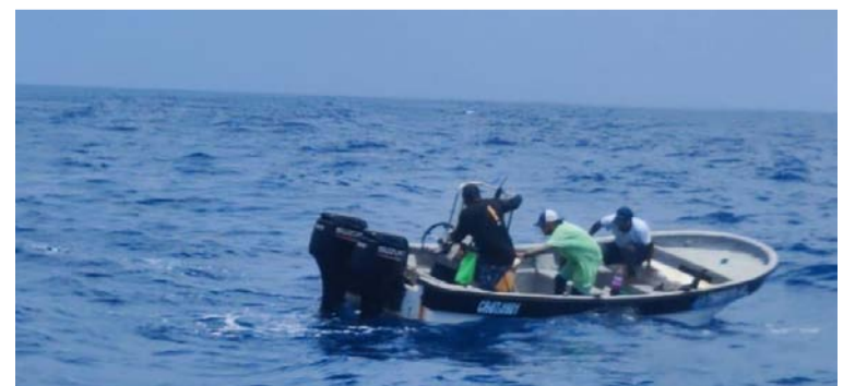
El motor de la embarcación de los pescadores se averió y debieron ser rescatados por la Armada Nacional.

La Armada de Colombia, a través del Comando Específico de San Andrés y Providencia, seguirá realizando operaciones navales de manera sostenida con el fin de salvaguardar la vida humana en el mar y garantizar la seguridad integral marítima en los espacios bajo su responsabilidad en el Caribe norte colombiano.