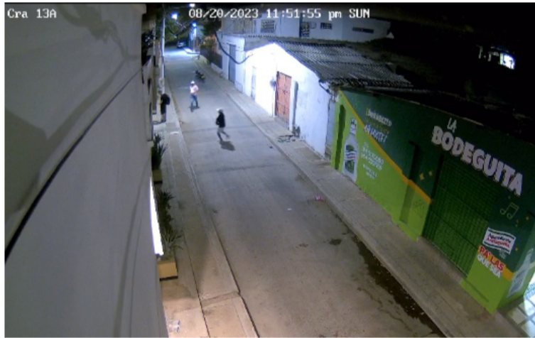
Los delincuentes sometieron a su víctima cuando pretendía ingresar a su casa. Fue despojado de un bolso y su celular.

El delito quedó registrado en videos de cámaras de seguridad de la zona, donde se ve en actitud sospechosa de ambos sujetos, uno vestía chamarra de color negro con gorra y pantalón blanco y el otro vestía jean azul y suéter de cuadros.