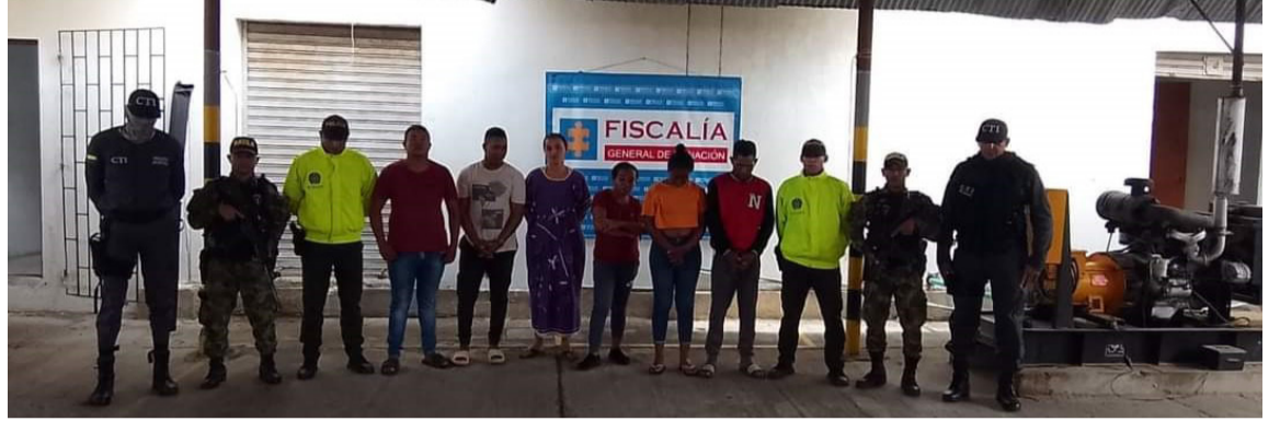
Las detenciones se efectuaron bajo una orden judicial en la Comuna 4 de Maicao.

ses de exhaustivas investigaciones las autoridades lograron recaudar elementos probatorios, que darían como resultado la captura con orden judicial de miembros de esta peligrosa banda criminal, un factor agravante en su actuar criminal