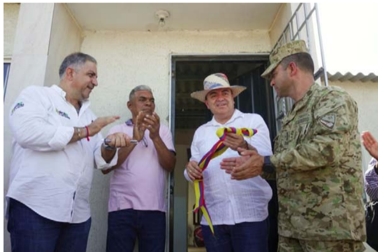
La entrega reafirma el compromiso del Gobierno nacional con el Fondo Adaptación para el bienestar de las comunidades.

"Celebro que hoy se pueda hacer entrega de estas viviendas a un número importante de familias que en