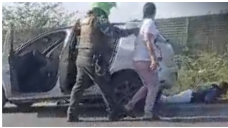
Momento de la captura del hombre y de la mujer por parte de la Policía Nacional en el municipio de Maicao.

es. La comunidad que estaba en la zona señaló que los menores iban saliendo de un centro educati-