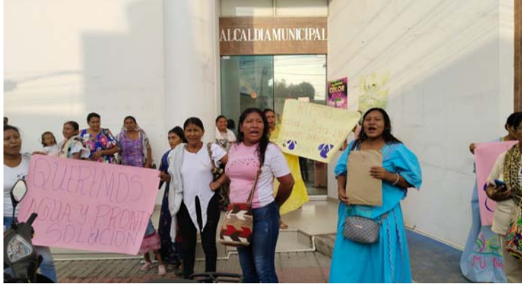
Denuncian que llevan más de un mes sin el servicio de agua debido al daño de la bomba sumergible del micro acueducto.

“No hemos sido ajenos a esta situación, conocemos