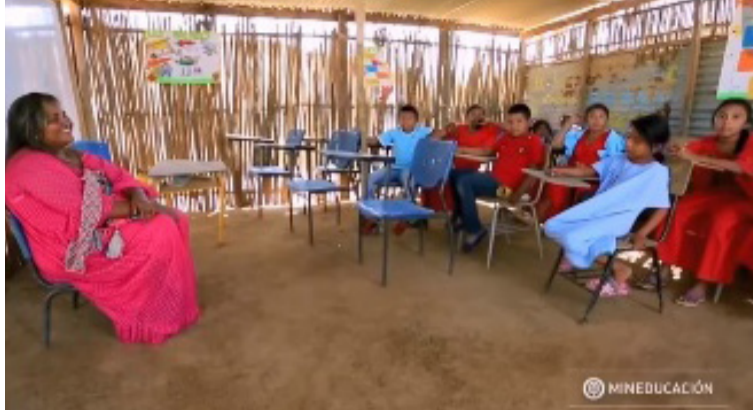
Para fortalecer el PAE, invitan a directores y rectores de instituciones educativas a compartir sus diagnósticos situacionales.

También llamamos a las comunidades, a estar al tanto de los cronogramas de concertaciones en comunidades indígenas sobre el PAE y la canasta educativa, manifestó el secretario de