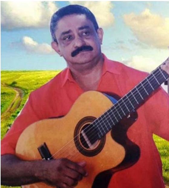
Hernando Marín Lacouture dejó para la historia vallenata la célebre canción 'Los maestros'.