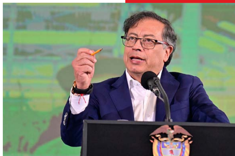
Petro aseguró que era imposible ese dictamen médico porque la enfermedad solo empezó a diagnosticarse en 1994.

Dijo el presidente Gustavo Petro sobre lo dicho por su hermano en Los Informantes: "Hay cosas que ya no entiendo en la relación entre la prensa y mi familia. Pero esto me dejó boquiabierto".