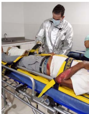
El adulto mayor fue llevado al Hospital San Agustín.

En la emergencia participaron 4 bomberos más la unidad de transporte.