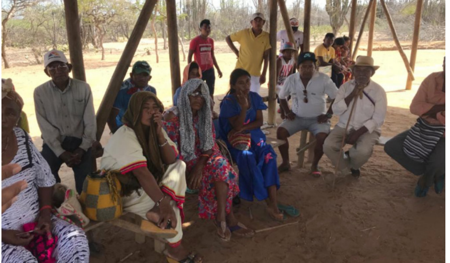
En la Sentencia T-302 se declaró la existencia de un estado de cosas inconstitucional (ECI) en el territorio guajiro.

Transcurrido un tiempo prudencial de valoración del Plan Provisional de Acción remitido por el Gobierno Nacional en cumplimiento de lo ordenado en el Auto 696 de 2022, la Alta Corte no aprobó el plan propuesto, emitiendo el auto 1290 del 4 de julio del 2023, en donde