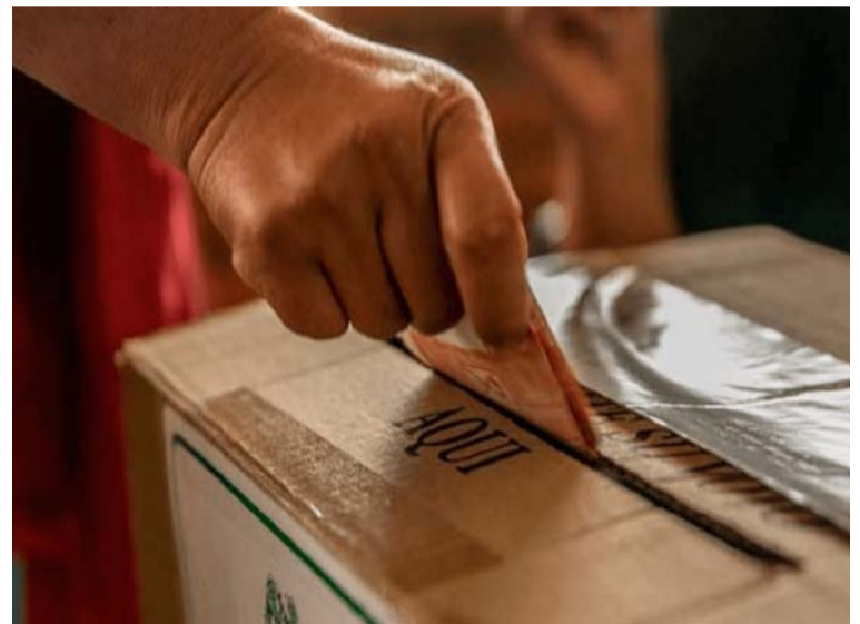
La decisión fue concertada de manera colectiva entre militantes, directivos, y avalados a las diferentes corporaciones.

Dijo, que lo importante es que la decisión fue concertada luego de un diálogo abierto y franco entre los militantes de la colectividad.