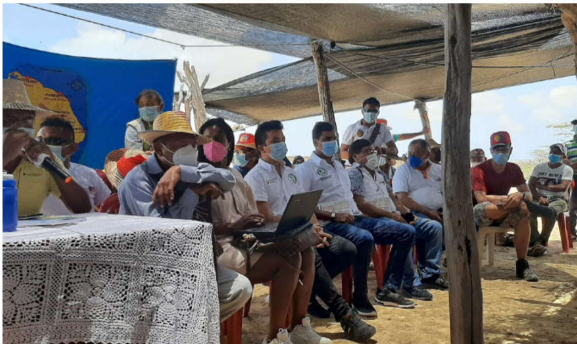
El Plan presentado, no cumplió a plenitud con los criterios invocados en el Auto 696 de 2022.

la Corte Constitucional, a través de la Sala Especial de Seguimiento, señala en el auto de 36 páginas, entre otros aspectos, que: “se advirtió que de las 83 acciones propuestas, únicamente 44 fueron asociadas de manera explícita a un objetivo. Frente a estas, se concluyó entre otras cosas, que solo las acciones propuestas por el Dane y el Ministerio de Salud cuentan con un cronograma.