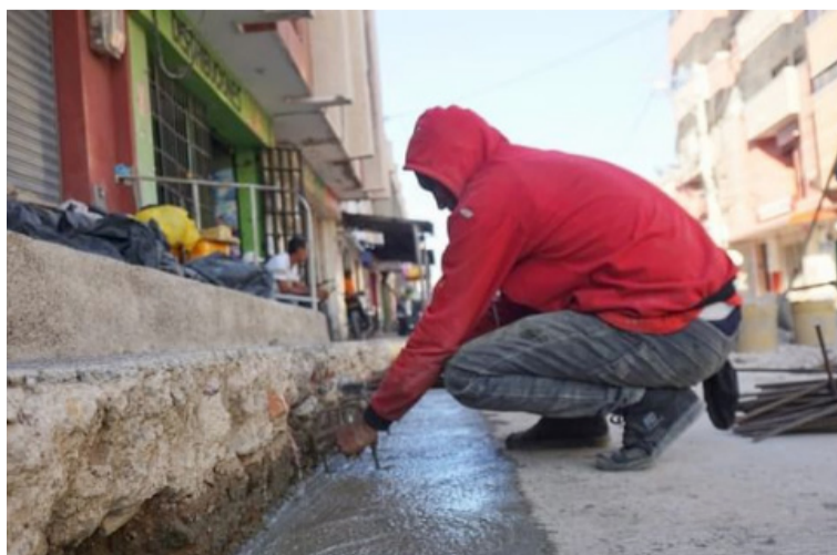
En Maicao realizan seguimiento periódico y dialogan con la comunidad sobre el desarrollo de las obras.

La administración municipal viene haciendo seguimiento al avance de las obras de inversión que se adelantan en diferentes sectores de Maicao.