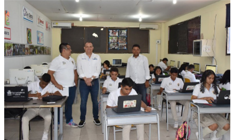
El burgomaestre reiteró que el propósito es mejorar y facilitar el aprendizaje de todos y cada uno de los estudiantes.