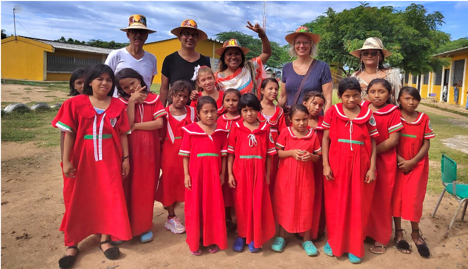
Esta conmemoración recuerda la resiliencia y valentía de las mujeres indígenas que luchan por causas reivindicadoras.