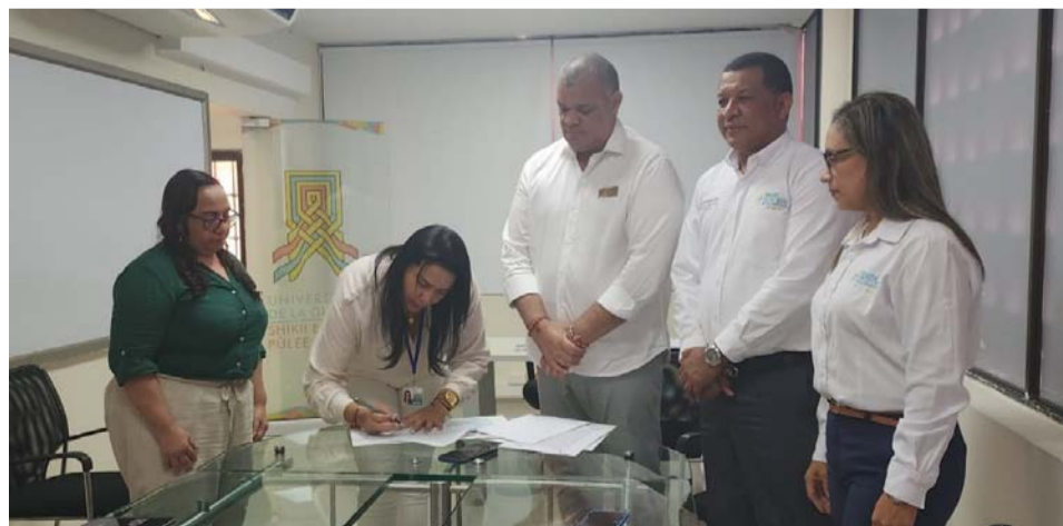
El convenio lo formalizaron la gerente de la ESE y el rector de Uniguajira.

Entre la facultades se encuentran los programas de ingeniería ambiental, civil, industrial, administración de empresas, contaduría pública, trabajo social, en las carreras técnicas; gestión documental y existe un convenio exclusivo para las prácticas de la Facultad de