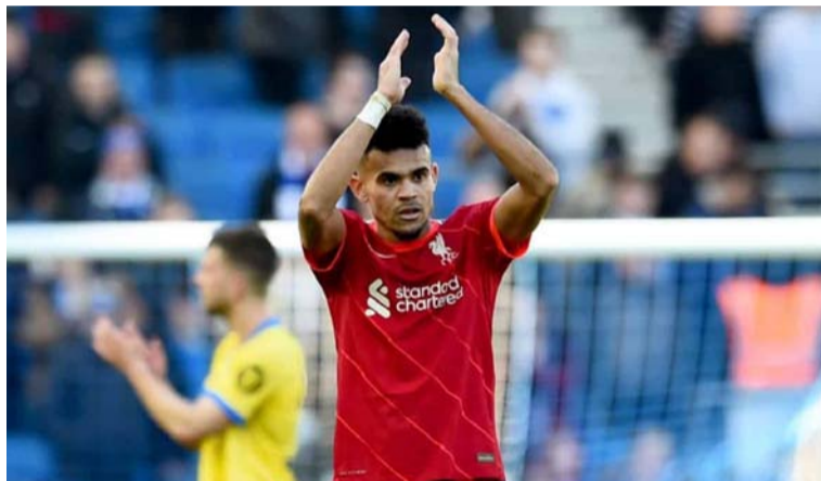
El atacante colombiano no tuvo su mejor presentación, en este encuentro, pero siempre fue desequilibrante.

El Liverpool de Inglaterra sigue 'imparable' en la Premier League, estando invicto tras cuatro fechas disputadas. Este domingo vencieron 3-0 al Aston Villa, con el guajiro Luis Díaz en cancha como titular y durante 63 minutos.