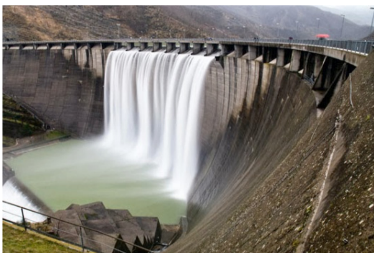
Se estima que por cada $100 que sube el precio en Bolsa impacta la tarifa al usuario final entre 1 y 2%.

que ha retrasado la marcha de los mismos. No se puede, entonces confundir la causa con el efecto. Es cuestionable que “para hacerle frente a esta situación se requieren medidas dirigidas a aliviar, mediante la suspensión de contratos de suministro de energía para generadores de Fncer en el Departamento de La Guajira”. Sí, se trata de “aliviar” a una de las partes de un contrato bilateral, a los generadores, a expensas de la otra, los comercializadores.