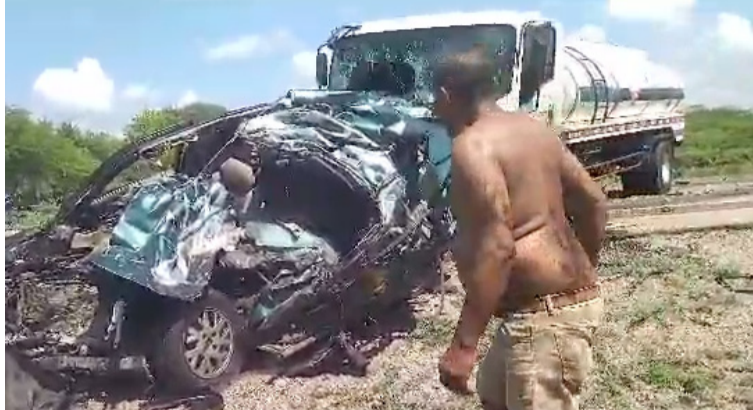
El automóvil conducido por Andrés Saldarriaga, quedó totalmente destruido al impactar de frente contra un carrotanque.