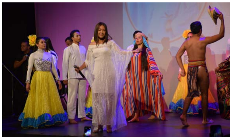
Las mujeres indígenas no están dispuestas a silenciarse, ellas son ancestralidad, creatividad y valentía.