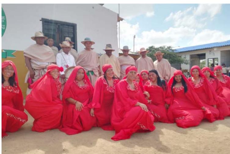
Este es un espacio donde estudiantes y comunidad pueden sumergirse en las tradiciones, arte e historia de los wayuú.