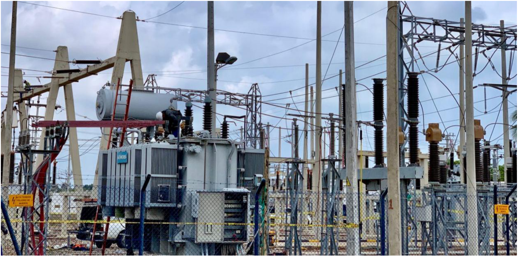
Los usuarios de La Guajira que, según los considerandos del Decreto in comento, no escapa a esta escalada alcista de las tarifas.

Semejante embrollo armado por el entrometimiento del Estado