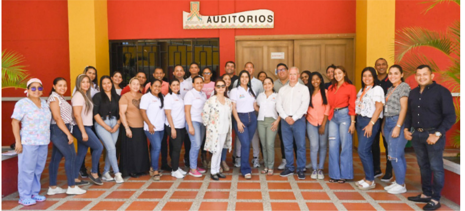
Todo el personal académico y administrativo de la Uniguajira recibió del 29 al 31 de agosto a los pares académicos del MEN.

Asimismo, la coordinadora académica de la sede