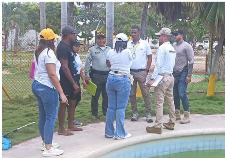
Se busca generar percepción de seguridad y contribuir a la convivencia y seguridad ciudadana.

Se hace referencia a determinar las medidas regulatorias de seguridad aplicables