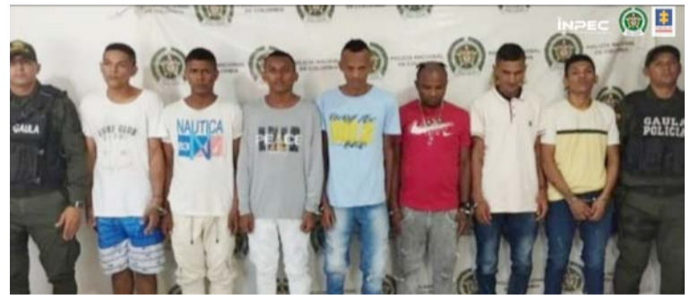
Ellos, al parecer, eran los encargados de enviar mensajes de texto y realizar llamadas a los familiares de las víctimas.