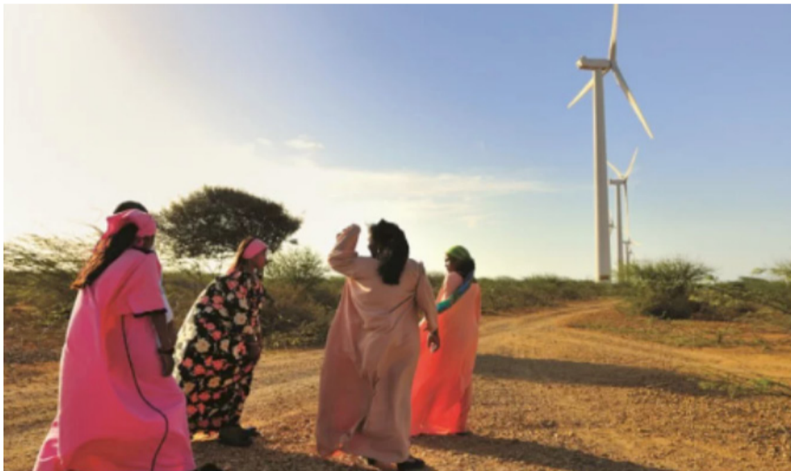
El boom de las 'energías limpias' no podrían menoscabar los derechos humanos de los wayuú.

Dentro de esa pirámide de pobreza y desarrollo desigual, se sostiene, que las poblaciones más afectadas con los fenómenos sociales señalados son: los pueblos indígenas y tribales que han habitado la región en distintos periodos históricos y que en ese devenir: aún se encuentran en los niveles