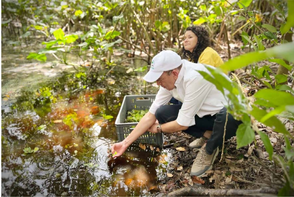
Las hicoteas fueron cuidadas en óptimas condiciones y luego liberadas en el ecosistema.