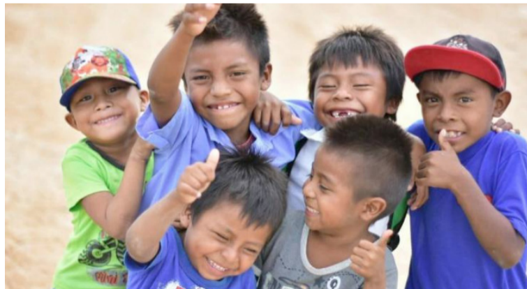
El nivel de conocimiento y apropiación del fallo permiten constatar un nivel de satisfacción alto de la orden.

Para ello, deberá demostrar, entre otras cosas: I) las estrategias y elementos tenidos en cuenta para que