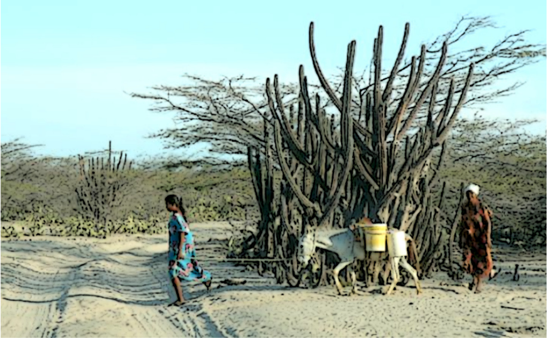
El territorio wayuú necesita más dolientes; aquellos con memoria histórica, que recuerdan lo hermosa de nuestra cultura.

Necesita más dolientes, aquellos con memoria histórica