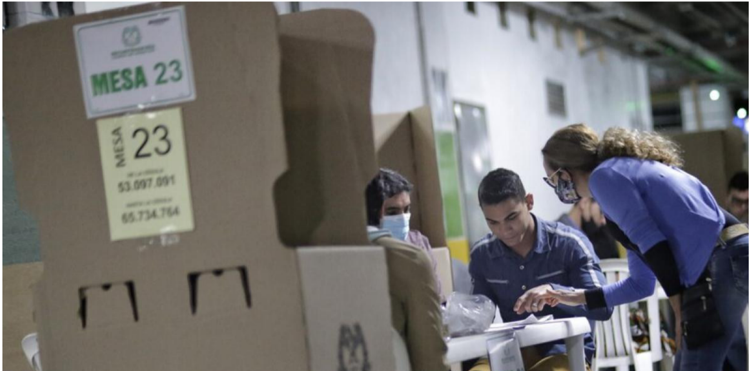
En los últimos años se ha presentado un aumento de participación electoral enmarcado por una fuerte competencia electoral.

Por otro lado, entre los que votaron, tal como afirman numerosos académicos como Lazarsfeld et al. (1944), los votantes colombianos del 2022 decidieron con anticipación su voto, incluso antes de que empezaran las campañas presidenciales, reforzando la hipótesis a comprobar en otros estudios adicionales sobre el papel determinan-