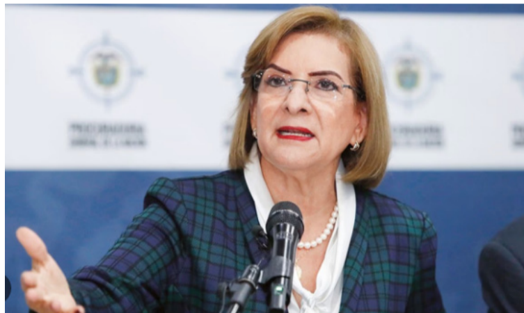
Margarita Cabello Blanco, procurador General de la Nación.

A lo tuyo tú. Luchemos unidos por nuestros derechos, de lo contrario seguiremos perdidos y jodidos, divididos y fraccionados por intereses y beneficios políticos y personales o contradicciones fatales. De frustrar las esperanzas en proyectos territoriales para nuestro bienestar colectivo, plasmado en la declaratoria de emergencia, invalidada por algunas formalidades pasajeras, de hecho, estallarán reacciones impredecibles, de justo inconformismo.