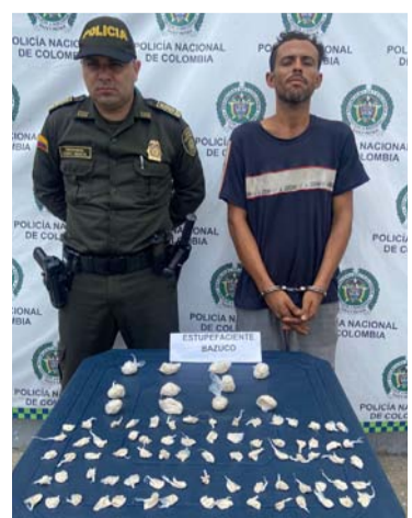
Esta persona fue dejada a disposición de la Fiscalía.

La Policía Nacional en ofensiva contra el microtráfico enmarcada dentro de la estrategia operativa 'Plan Choque Seguridad 360' obtuvo la captura de una persona portando varias dosis de estupefacientes por el barrio San Martín del municipio de Maicao.