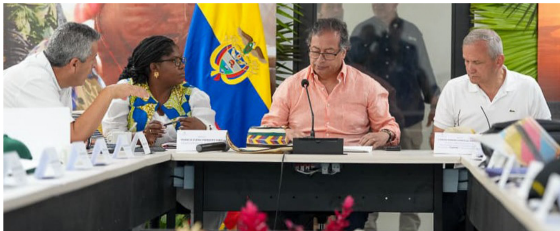
El gobierno decretó la Emergencia como una alternativa para resolver la falta de agua.