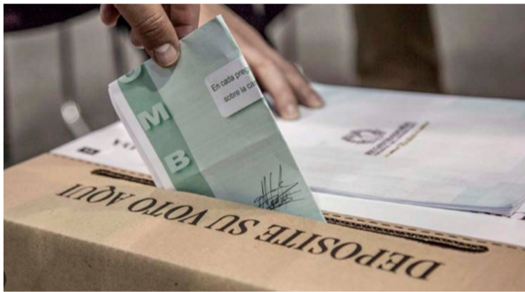
Entre mayor interés y conocimiento sobre los asuntos políticos se presentó una mayor participación electoral.

te del contexto de crisis económica y la pérdida de legitimidad de los partidos tradicionales en la decisión del voto.