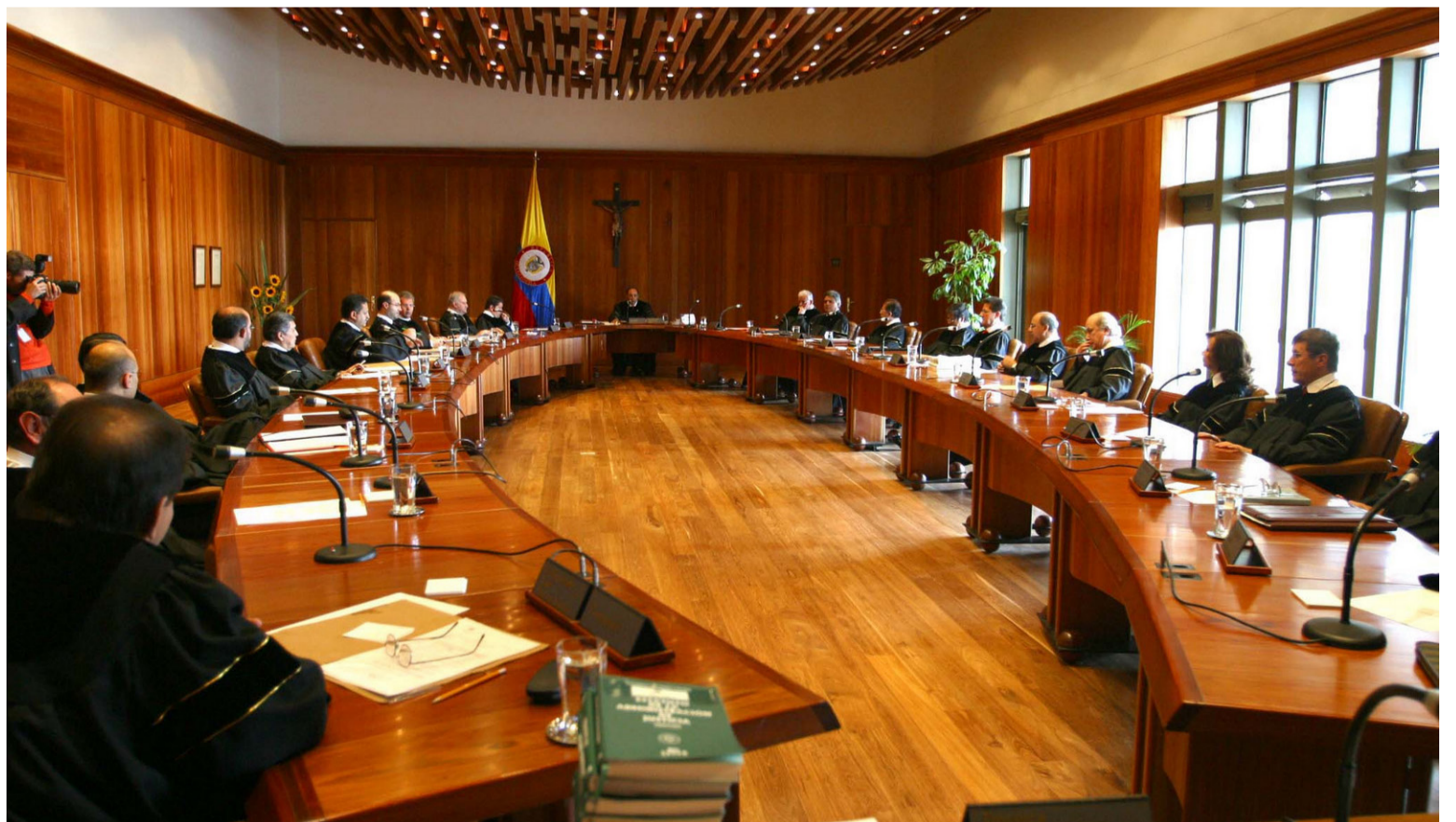
Alcaldes y representantes de La Guajira brillaron por su ausencia en la audiencia pública celebrada en Corte.