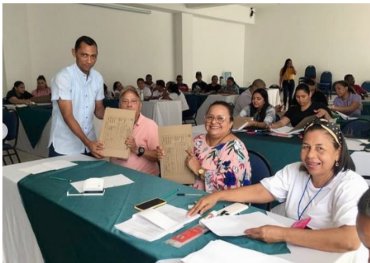
El objetivo es poder ofrecer un servicio de calidad al público en general desde todas las áreas y optimizar el proceso.