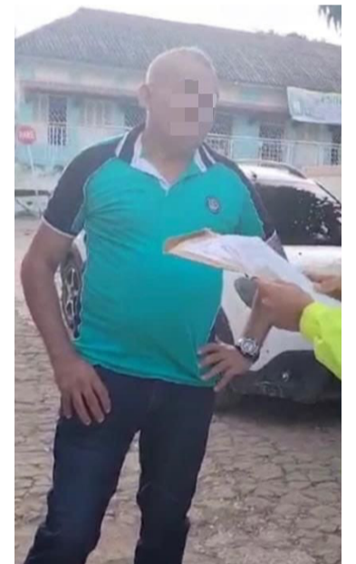
Estos sujetos serían los encargados de intimidar a ganaderos, palmicultores y comerciantes en los Montes de María

ral de Arjona, Bolívar, dando cumplimiento a órdenes de captura emitidas por la Fiscalía Primera Especializada de Cartagena por el delito de extorsión. Así mismo, se logró la captura de alias Financiero, en el área general de Candelaria, corregimien-