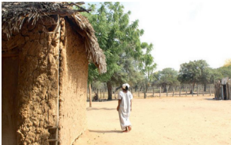
Dentro de esa pirámide de pobreza y desarrollo desigual los más afectados son los pueblos indígenas y tribales.

de menor desarrollo humano, carentes de las condiciones mínimas que precisa la existencia digna, y sobre todo, en riesgo de desaparecer como grupos étnicos.