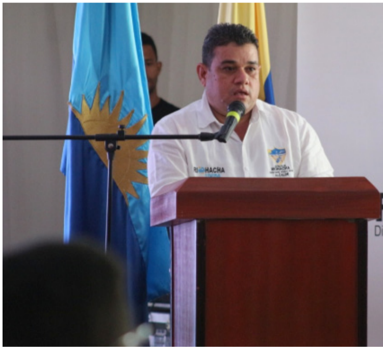
Suaza dijo que en los próximos días dará a conocer a quien respaldará a la Alcaldía del Distrito de Riohacha.

"Fue una decisión que obedece a que actualmente estoy atendiendo unas in-