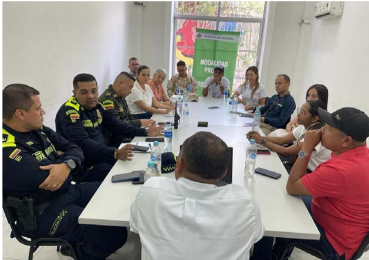
Se analizarán los casos de tres muertes violentas que se originaron ayer en dos barrios de la capital de La Guajira.

El secretario de gobierno de Riohacha, desde la administración distrital rechaza estos hechos violentos donde perdieron la vida tres personas en dos ataques a bala aislados, “llevaremos a cabo