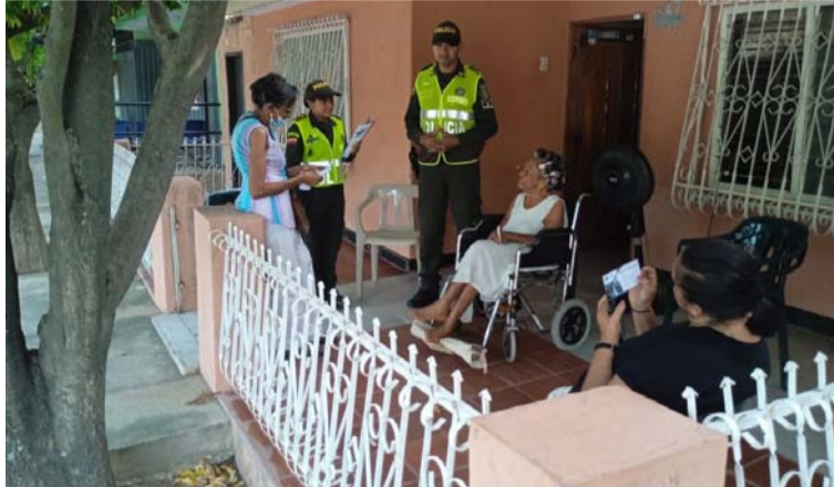
La campaña se realizó por parte del Departamento de Policía Guajira a través de los Gestores de Participación.

La campaña se realizó con un puerta a puerta, por parte del Departamento de Policía Guajira a través de los Gestores de Participación Ciudadana, donde recorrieron cada una de las calles de esta localidad para