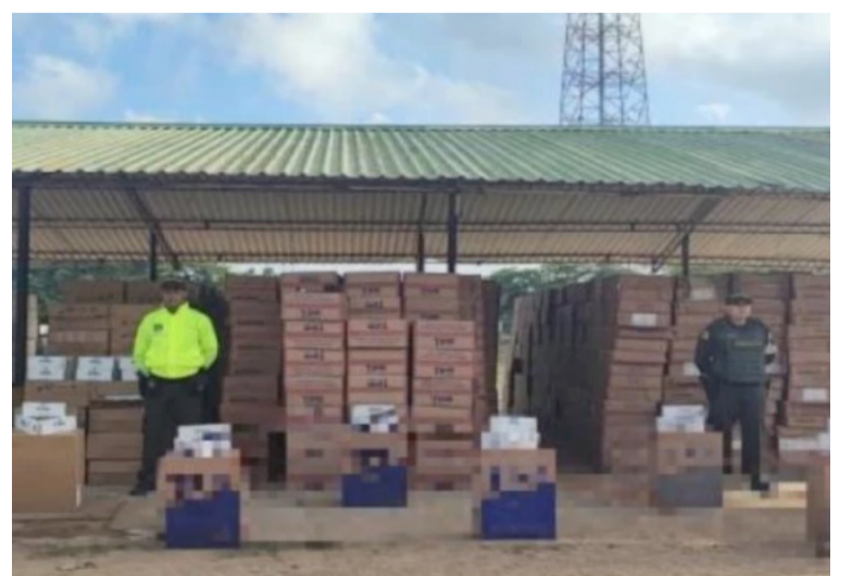
En estas cajas se hallaron las 780.500 cajetillas de cigarrillos de contrabando incautadas por la Policía.

estas actividades delincuenciales afectan la salud e integridad de los habitantes del departamento de La Guajira, así como el progreso económico del país debido a la evasión de impuestos que, en el caso de los cigarrillos, están destinados a la salud, deporte y educación de millones de colombianos.