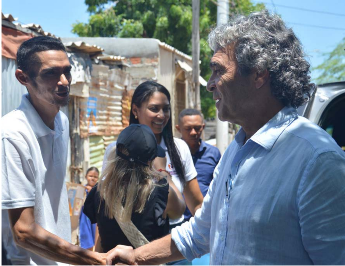
Sergio Fajardo escuchó los relatos de varias familias que le mostraron cómo vivían.

“Todo está en la cabeza, porque usted puede echar todos los discursos que quieran y pueden sonar muy bonitos, pero después usted del discurso tiene que pasar a que las cosas se hagan y para eso necesita organización, se necesita formar un equipo, esa es la clave de todo esto todo esto, y nosotros en Colombia lo podemos hacer y aquí en La Guajira se puede hacer”, manifestó.