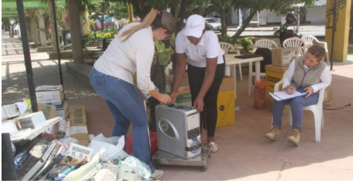
Los elementos fueron transportados a diferentes plantas de aprovechamiento del país.

Los municipios que se unieron a esta campaña