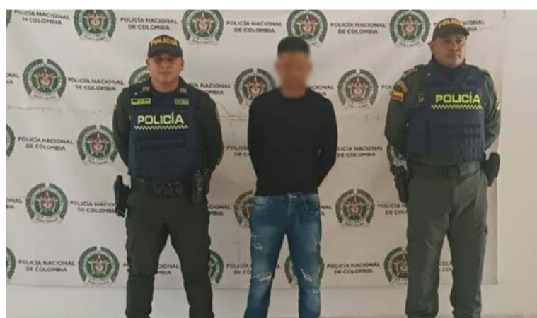
La captura del joven de 26 años se realizó en la comunidad de Sumain Wayuu tras denuncia de su progenitora.

agentes de la Sijín, el pasado 5 de septiembre en vía pública del barrio El Páramo de Valledupar (Cesar), en cumplimiento de una orden judicial. Cabe anotar que el procesado está siendo investigado por otros homicidios.