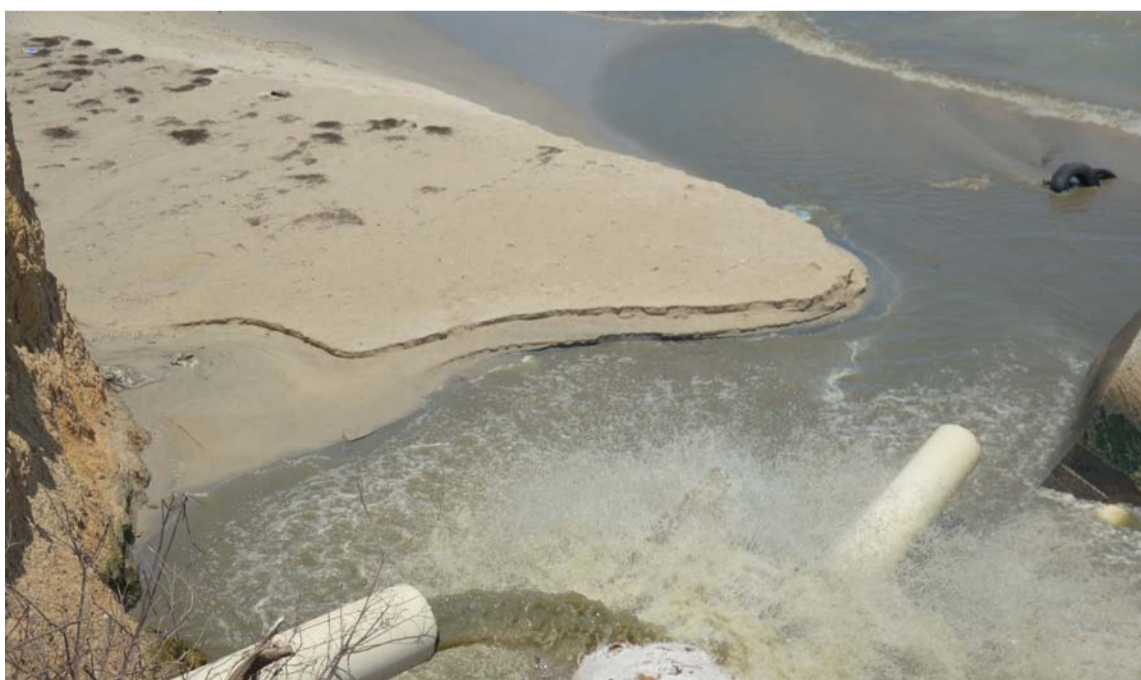
Fajardo recorrió las calles hasta llegar a la playa donde descargan las aguas residuales.