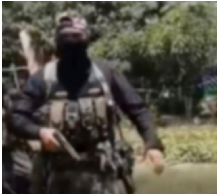
Despierta sospecha la vestimenta de estos hombre con pasamontañas, pues algunos aparecen con buzos negros.

Los militares, presuntamente adscritos al batallón Junín, habrían llegado hasta la vereda Bocas de Manso luego de ser alertados de presencia de grupos al margen de la ley, al llegar