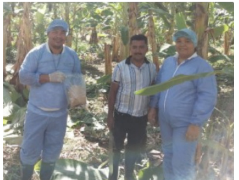
El ICA realizó una brigada fitosanitaria del 4 al 8 de septiembre, en predios de plátano y banano en la Troncal del Caribe.

El departamento del Magdalena tiene una gran importancia en el cultivo de