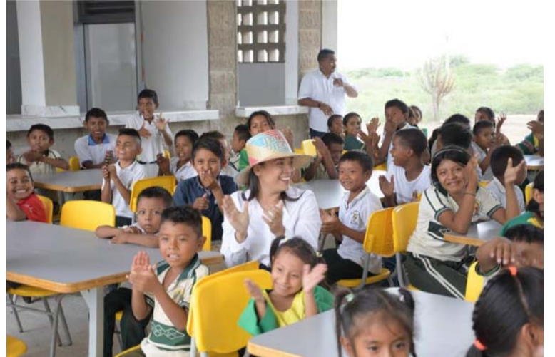
Los comedores están equipados con una despensa, cocina, zona de lavado, recolección de residuos y un espacio cubierto.

“Este logro demuestra nuestro compromiso continuo de #SalvarVidas, así mismo fortalecemos la infraestructura educativa en La Guajira, mejorando así las oportunidades para las generaciones futuras”, expresó la gobernadora Diala Wilches Cortina.