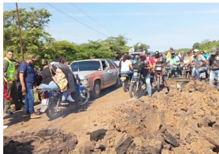
Los que viajan a Colombia deben hacer transbordo, mientras que otros conductores prefieren hacerlo por trochas.