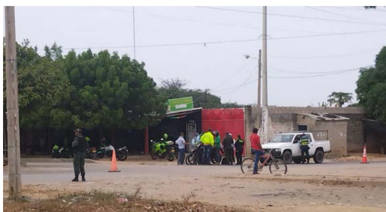
La iniciativa policial se va a desarrollar de manera programada en cada uno de los barrios de la Comuna 10.

Con toda la oferta institucional y las seccionales de Investigación Criminal (Sijín), Gauja de la Policía, Turismo y Secretaría de Gobierno de Riohacha, se tomaron el barrio Dividivi, en un comando situacional, debido a los hechos de homicidios y otros delitos que han ocurrido en este sector de la capital de La Guajira.