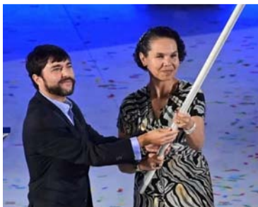
Colombia perdió la sede de los Panamericanos.

La Procuradora General de la Nación, Margarita Cabello Blanco, indicó que la entidad continúa recaudando pruebas en el proceso disciplinario abierto por la pérdida de la sede de los juegos Panamericanos para Barranquilla.