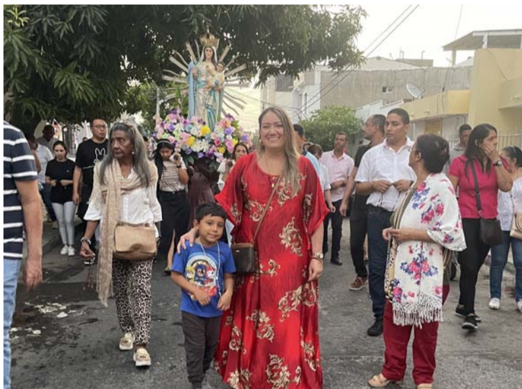
Cultivar en el corazón de la niñez la devoción mariana es una tarea que se hace visible en el Rosario de Aurora.

la estatura. Esto debido a que algún desbalance en los cuatro extremos provocaría que uno, o dos de los lados, llevaran más peso que el usual.