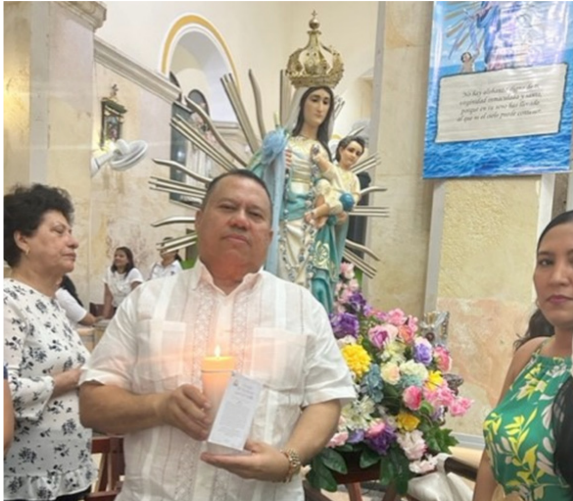
Decía mi padre que para verle la cara a la Virgen hay que vestirse a la altura de su grandeza.

Decía mi padre que para verle la cara a la Virgen hay que vestirse a la altura de su grandeza porque es un momento muy sublime de categoría y protocolo exigente, por eso se preparaba con suficiente anticipación, una semana antes ya estaba guin-