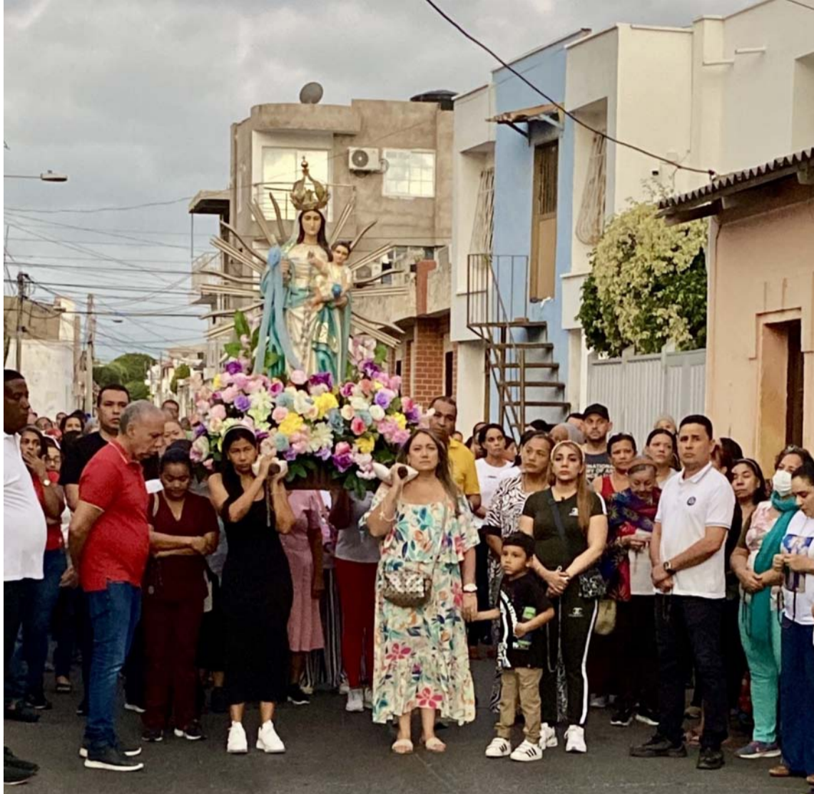
El día despunta cuando ya ha iniciado el recorrido por las calles de Riohacha.

Durante el rezo del Rosario, dignamente liderado por las comunidades de feligreses de las distintas parroquias, los fieles rodean fervientemente, la bella estatua de la Virgen de los Remedios llevada en procesión. Los hombres de los agradecidos devotos sirven para sostener la imponente imagen alrededor de la cuál, se sitúa el fervoroso pueblo orante. Hombres y mujeres se organizan de manera silente, a veces mediante imperceptibles miradas y gestos cuando se halla entre la multitud que desea cargarla, al que sería el compañero o compañera ideal en razón a la coincidencia en