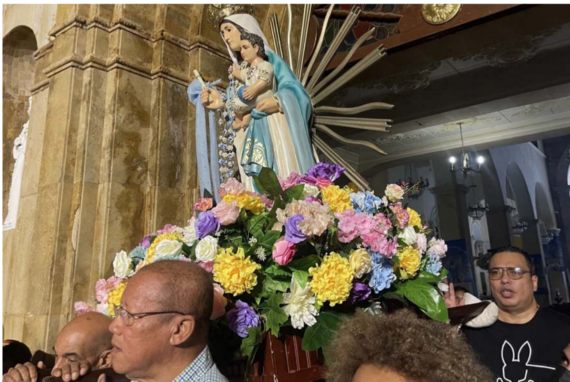
Hombres y mujeres se dividen la noble tarea de llevar a la Virgen en hombros.

Cada travesaño sobre el cual se eleva la imagen, es cuidadosamente custodiado por los entusiastas guardianes marianos tanto mujeres como hombres, quienes rezan, cantan y vitorean con agradecimiento, respeto y entusiasmo, a la aclamada y santa mujer, que une y convoca durante diez días, muy temprano, a sus madrugadores hijos. Son incontables los motivos y las historias que motivan