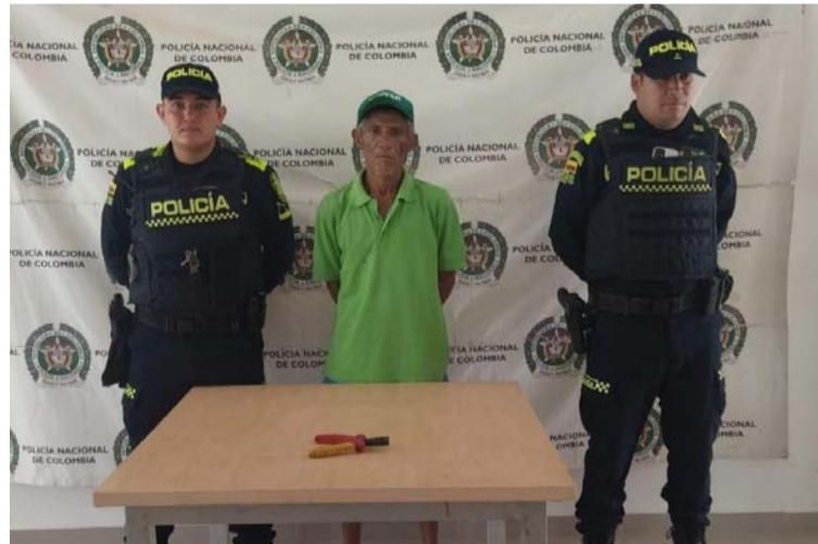
La colaboración con las empresas de servicios es crucial para identificar de manera efectiva este tipo de delitos.

parte de los esfuerzos continuos de la Policía Nacional para mantener la seguridad en la región y garantizar que los ciudadanos puedan disfrutar de un entorno seguro y protegido.