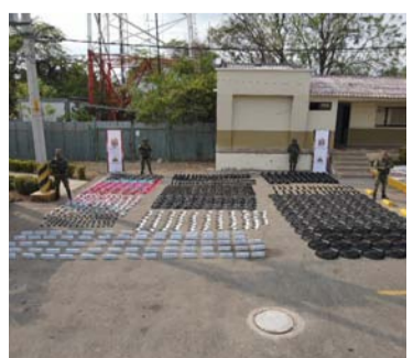
En la acción se incautó distinto tipo de mercancía.

Los militares se encontraban en la carretera nacional, a la altura de San