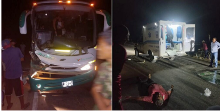
Se indicó que los turistas que iban en el bus resultaron ilesos ante el fuerte choque entre los dos automotores.

El accidente vial ocurrió la noche del jueves 1 de febrero, a la altura del kilómetro 4 vía Manaure al municipio de Uribia, comunidad de Betel, hasta donde llegaron las autoridades competentes para las urgencias de rigor.