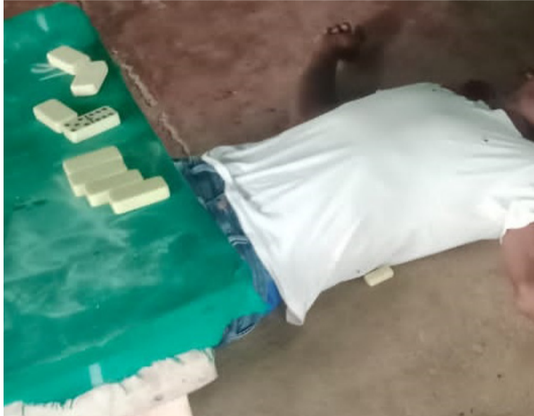
Sujetos con fusiles llegaron al billar y dispararon en varias oportunidades contra dos hombres que jugaban dominó.

El ataque se registró la mañana del viernes 2 de febrero en un billar llamado 'Las Llantas' en el kilómetro 51 del corregimiento de Pelechúa, cuando sujetos armados con fusiles llegaron al billar y dispararon en varias oportunidades.