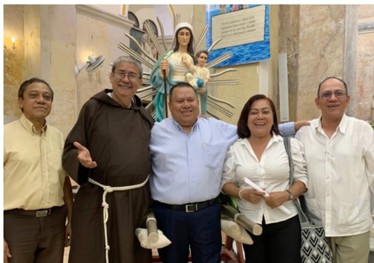
La Reina vitalicia de los altares riohacheros llegó a la ciudad para quedarse y por afortunada equivocación.

¡Virgen de Los Remedios cuídanos y abre los ojos a tu pueblo ante las amenazas de tantas tempestades!!