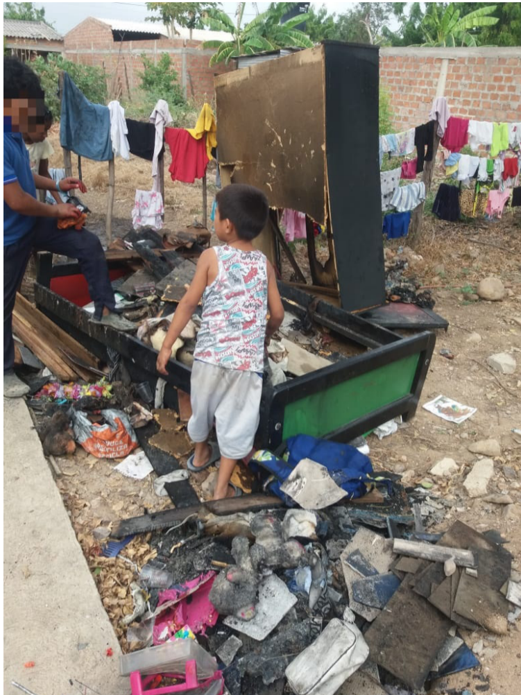
El incendio fue atendido por un carro cisterna que transportaba en ese momento agua para las comunidades indígenas.

ba agua para las comunidades indígenas y alcanzó a llegar al sitio del incendio para atender la emergencia que ponía en riesgo a las demás viviendas del sector.